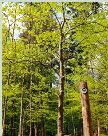
Junger Baum und Robinienpfahl

Die Nummern sind bei jungen Bäumen an einem in der Nähe eingeschlagenen Robinienpfahl angebracht. Bei größeren und älteren Bäumen befinden sie sich direkt am Baum. Hinter dieser Nummer finden Sie eine farbige Plakette, welche unsere verschiedenen Grabstätten kennzeichnet (Gemeinschaftsgrabstelle, Partner- und Familiengrabstätte) und beschreibt, um was für einen Baum es sich handelt (Junger, Mittlerer oder Alter Baum). Die Bedeutung der farbigen Plakette wird Ihnen in der nebenstehenden Tabelle näher beschrieben.