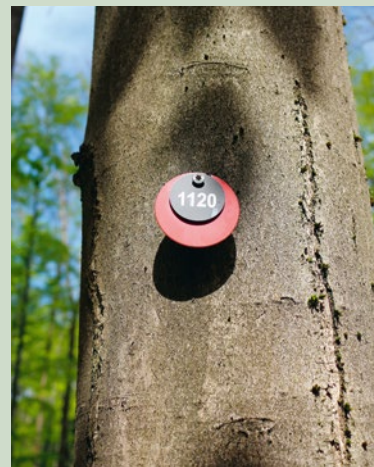
Nummer direkt am Baum

Bäume und Findlinge mit farbiger Plakette sind noch zu erwerben.